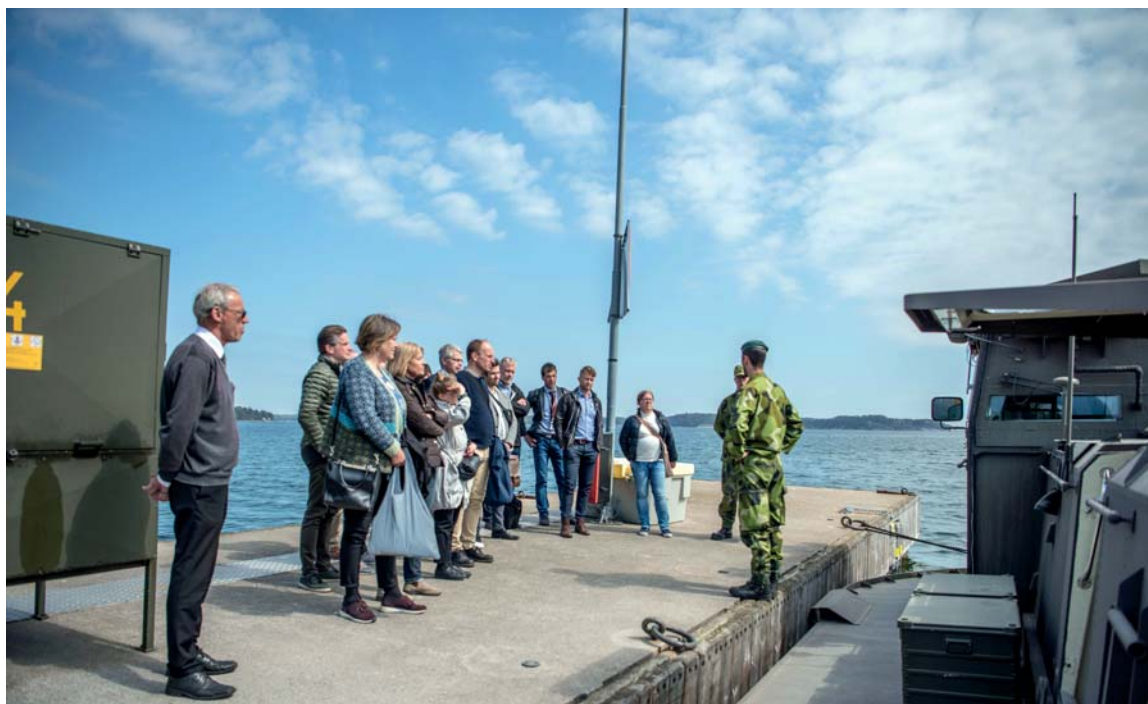
Under besöket fick centrala Försvarsmaktsrådets representanter en genomgång av den förarutbildning som genomförs på Amfibieregementet. Genomgången avslutades med en tur i en av de svävare förbandet använder.