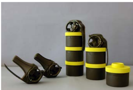
NY TRYCKHANDGRANAT. Påbyggingsbar i moduler.

konform. Därmed sprids inte splitter åt alla håll utan bara där det finns ett militärt värde.