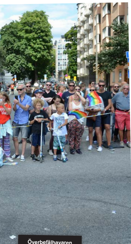
Överbefälhavaren gillade att gå i Pride.

och marina förband men också i specialförband.