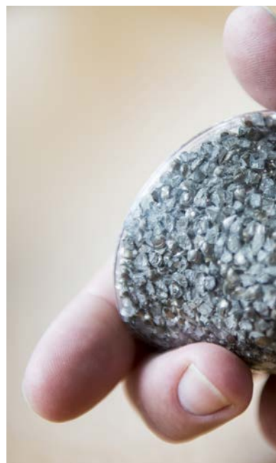
NY BESTÅNDSDEL. Splittret i handgranat 07 är ingjutet i plast.