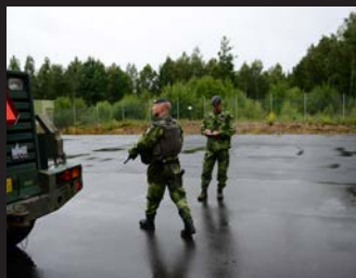
Ständigt med anteckningsblock i hand.