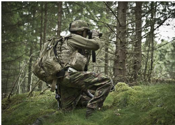
Övningen hölls bland annat i Skillingaryd, Småland.

INOM FÖRSVARSMAKTEN finns specialister på att hantera själva sprängladdningarna när de påträffas. Därtill finns även kriminalteknisk kompetens som med hjälp av avancerad utrustning kan använda dessa påträffade hot för att ta reda på information. Information som kan bidra till att man får kunskap om hur laddningen är konstruerad, och även ledtrådar om vem som gjort det. När detta sedan sammanförs med gediget underrättelsearbete börjar de