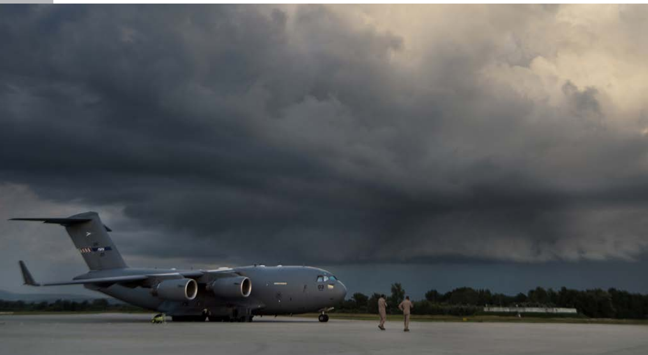
SÖNDAG 20.03, PAPA. Inför avfärd seglar ett elakt åskoväder upp – något man inte vill starta in i.