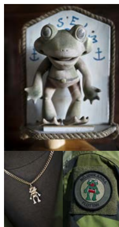
OVAN: Original-Anselm. NEDAN: Ständigt förekommande hos röjdykarna.

Röjdykarna hedrar honom genom att äta Anselmbakelser på hans namnsdag den 21 april och alla röjdykare har Anselm som smycke runt halsen.