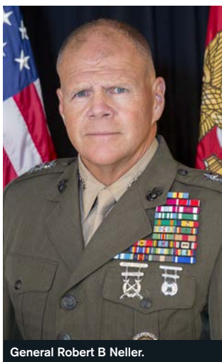
General Robert B. Neller.

Han utlovade också betydligt mer skyddsvärnsgrävande, personlig maskering och fältmässiga förhållanden för ma-