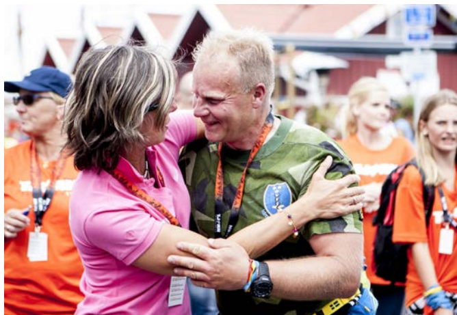
Idrottsveteranerna och Försvarsmakten samarbetar.

P Å VETERANDAGEN undertecknades en överenskommelse mellan Försvarsmakten och föreningen Idrottsveteranerna om ekonomiskt stöd.