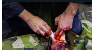
En soldat har fått en större sårskada på låret och blodflödet måste stoppas omedelbart. Med rätt rekvisita blir momentet högst trovärdigt.