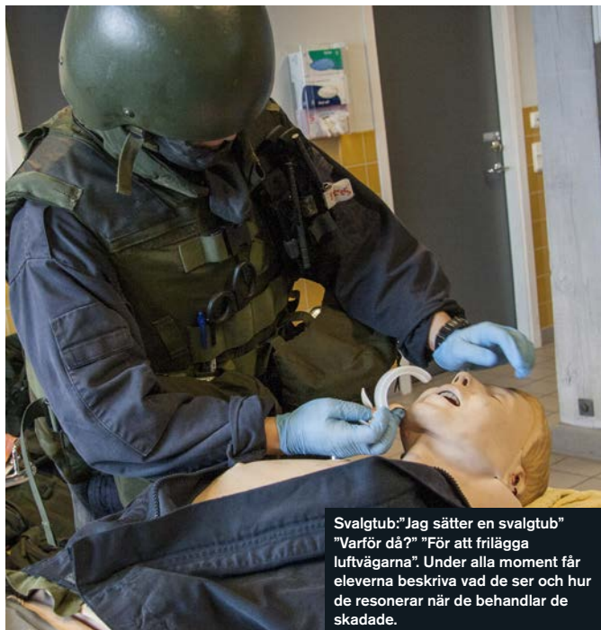
Svalgtub: "Jag sätter en svalgtub" "Varför då?" "För att frilägga luftvägarna". Under alla moment får eleverna beskriva vad de ser och hur de resonerar när de behandlar de skadade.

Som komplement tog skolan tidigare in en civil sjukvårds-