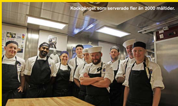
Kockgänget som serverade fler än 2000 måltider.

Hela besättningen, officer som sjöman, hjälper till att bära ombord livsmedel till fartyget.