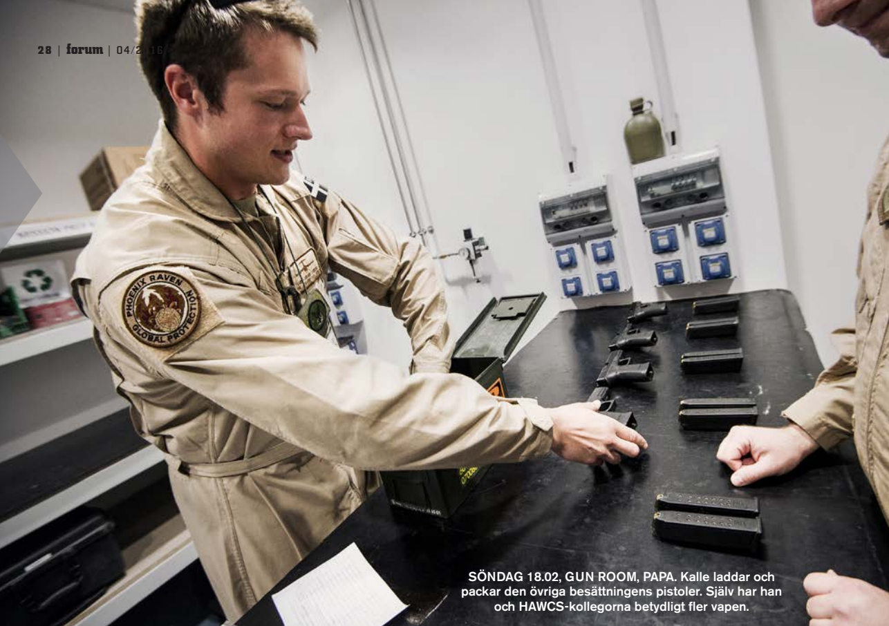
SÖNDAG 18.02, GUN ROOM, PAPA. Kalle laddar och packar den övriga besättningens pistoler. Självt har han och HAWCS-kollegorna betydligt fler vapen.