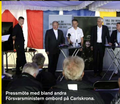
Pressmöte med bland andra Försvarsministern ombord på Carlskrona.

– Utmaningen har varit att hålla koll på alla besökare och gäster som rör sig ombord och kontrollera vilka som är behö-