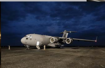
FRÅN VÄNSTER TILL HÖGER: En palett på en C17 kan lasta upp till och med 4500 kilo. Totalt ryms 18 paletter i planet.