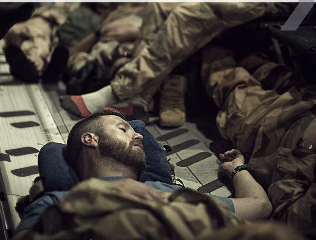
ONSDAG 00.07, EN MIL ÖVER TIMBUKTU. I sex månader har Mali03 tjänstgjort i Timbuktu. När de passerar platsen på väg hem, sover de flesta.