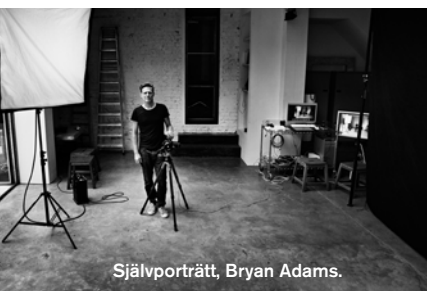
Självporträtt, Bryan Adams.