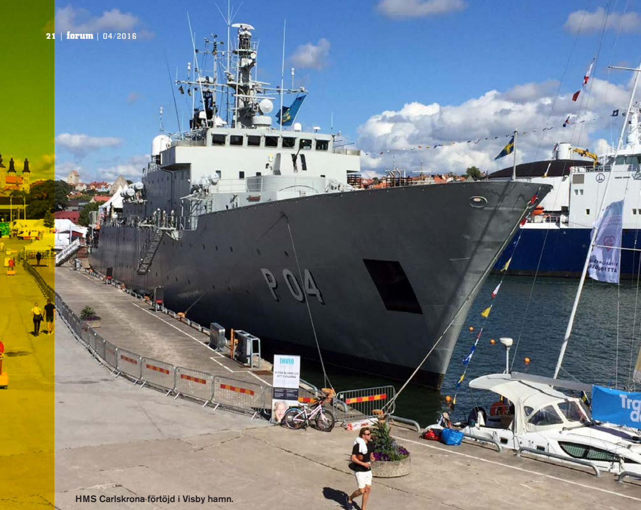
HMS Carlskrona förtöjd i Visby hamn.