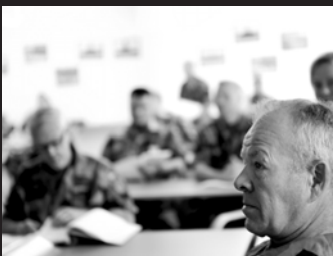
Genomgång i Ronneby.