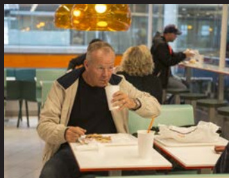
Snabbmiddag för generalmajor.