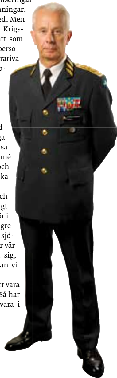
Sverker Göranson Överbefälhavare

Att vara anställd i Sveriges försvarsmakt – att vara en av de utvalda – är något att vara stolt över. Så har det varit historiskt och så kommer det att vara i framtiden.