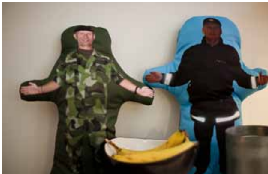
Många hör av sig till Invidzonen med goda idéer, till exempel denna kudde med bild på den förälder som är på utlandstjänstgöring.

Invidzonens stöd sträcker sig även utanför Försvarmakten. Sedan i somras får också anhöriga till Polisens