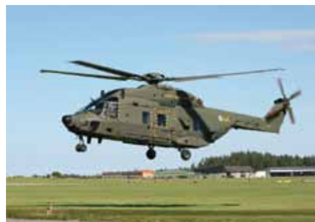
Försvarens makten har tagit emot fyra helikopter 14, av de 18 som är beställda.