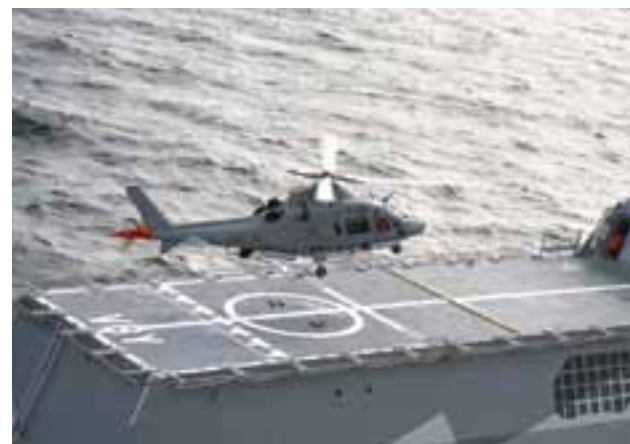
Helikopter 15 landar på korvetten Visby.

– Sen tar det ju ett tag innan de är färdigutbildade. Målsättningen är därför att kunna rekrytera från andra delar av Försvarens makten, samtidigt som vi för-