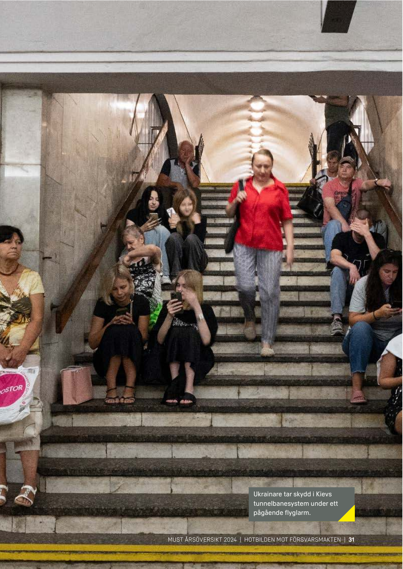
Ukrainare tar skydd i Kievs tunnelbanesystem under ett pågående flyglarm.