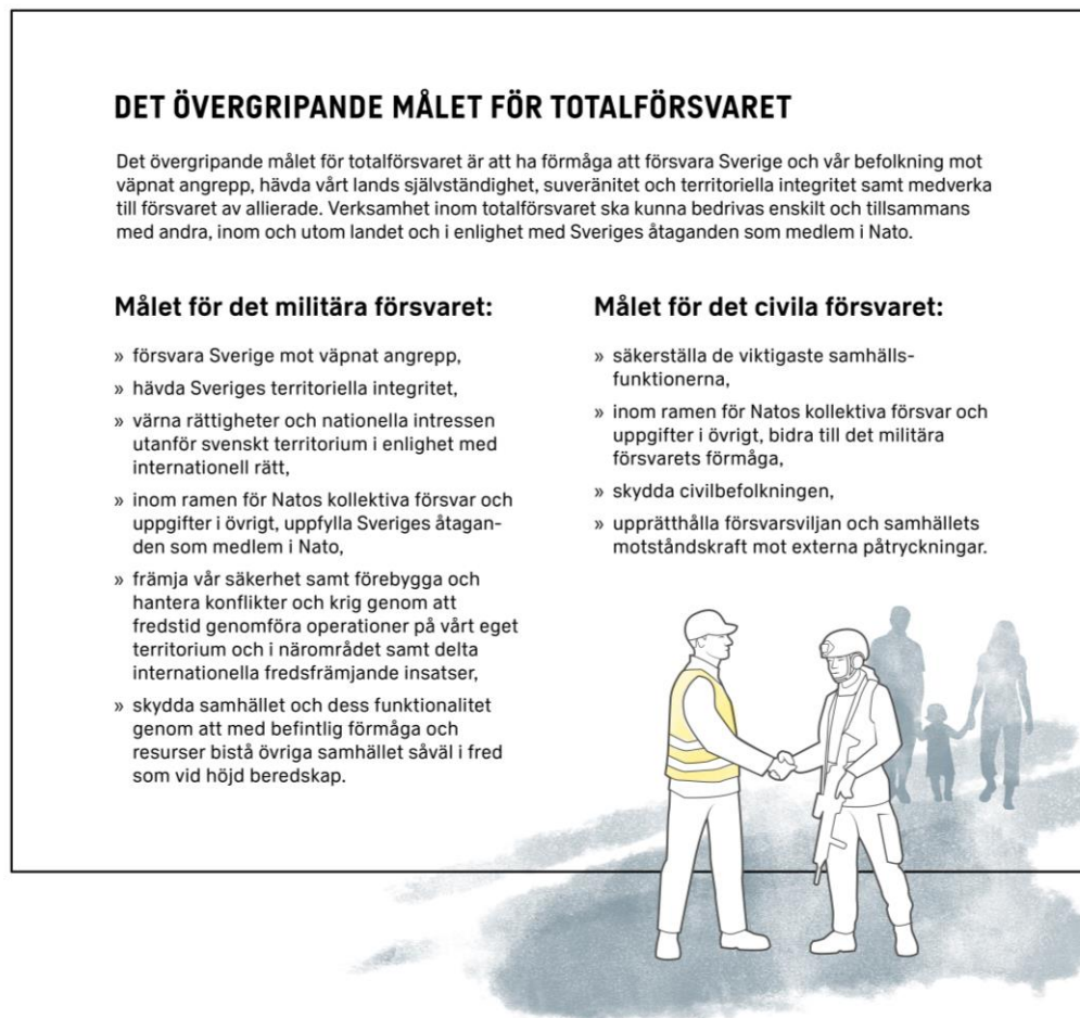
Illustration 1 - Det övergripande målet för totalförsvaret, målet för det militära respektive civila försvaret

I kapitel 2 kompletteras och konkretiseras regeringens inriktande planeringsförutsättningar. Dimensionerande typsituationer beskrivs i kapitel 3 och i kapitel 4 redogörs för möjliga händelseutvecklingar och konsekvenser på samhället. I kapitel 5 följer ett antal slutsatser som Försvarsmakten och Myndigheten för civilt försvar bedömer som viktiga att omsätta till handling. Samtliga kapitel i dokumentet behöver dock analyseras, kompletteras och omsättas i planering eller direkta åtgärder av berörda aktörer för att nå det övergripande målet för totalförsvaret 6 .