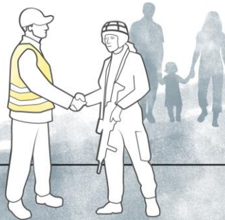
Illustration 1 - Det övergripande målet för totalförsvaret, målet för det militära respektive civila försvaret

Ett centralt budskap i dokumentet är att Sverige som allierad i Nato har förändrat förutsättningarna för det svenska totalförsvaret i grunden. Sveriges integration i Nato innebär att svenska myndigheter, och samhället i stort, behöver vidta åtgärder och genomföra aktiviteter som skapar förutsättningar för Sveriges förmåga att genomföra Natos kärnuppgifter 7 .