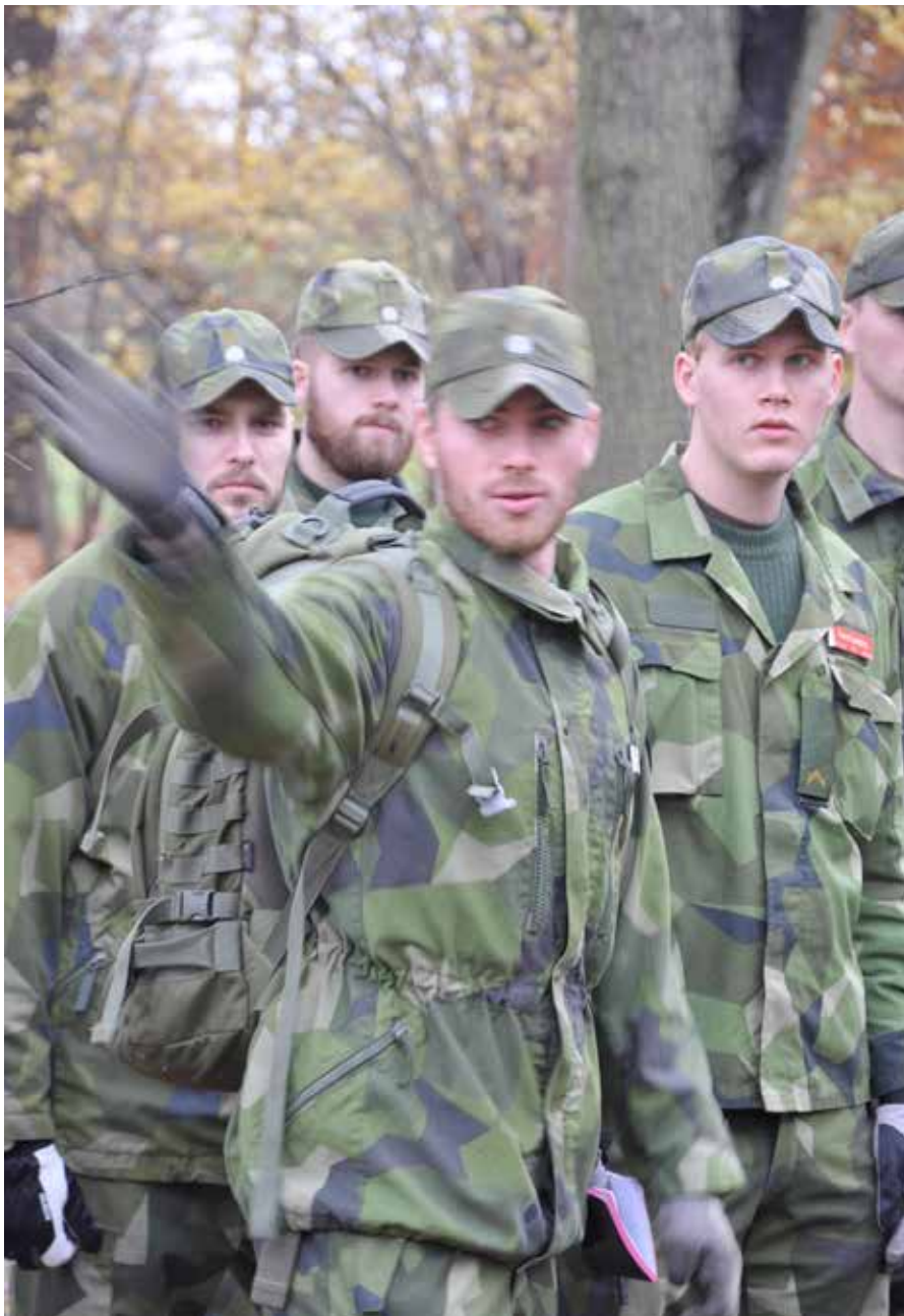
PEKA MED HELA HANDEN. MHS Karlbergs kadetter kan redan det som särskiljer civilister från blivande officerare.