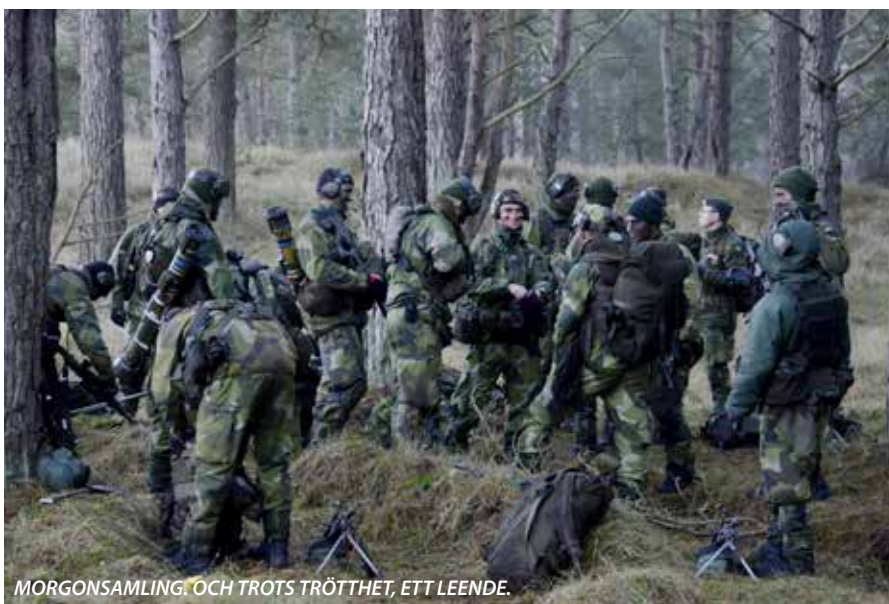
MORGONSAMLING. OCH TROTS TRÖTTTHET, ETT LEENDE.