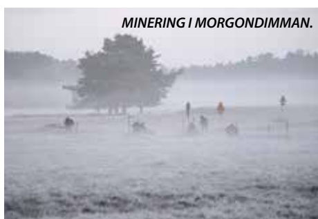
MINERING I MORGONDIMMAN.