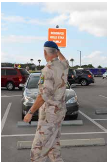
Bästa parkeringsplatserna utanför stormarknaden är reserverade för de som förlorat en familjemedlem i strid.