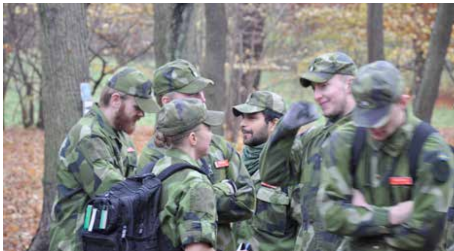
Morgondagens officerare och kollegor utbildas på MHS Karlberg sedan 1792. På slottet Karlberg, beläget i Solna bodde också kung Karl XII i sin ungdom.

högre gemensamt mål. Det handlar inte om att detaljstyra.