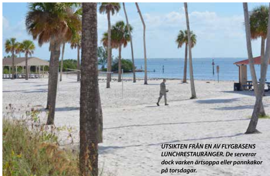
UTSIKTEN FRÅN EN AV FLYGBASENS LUNCHRESTAURANGER. De serverar dock varken ärtsoppa eller pannkakor på torsdagar.

– Sedan är det också stort fokus på vad som händer med den internationella närvaron vid CENTCOM efter 2014. Befintlig finansiering för koalitionen är då slut, USA betalar nämligen närvaron för en tredjedel av länderna. Därför har Pakistan åtta man här medan Sverige