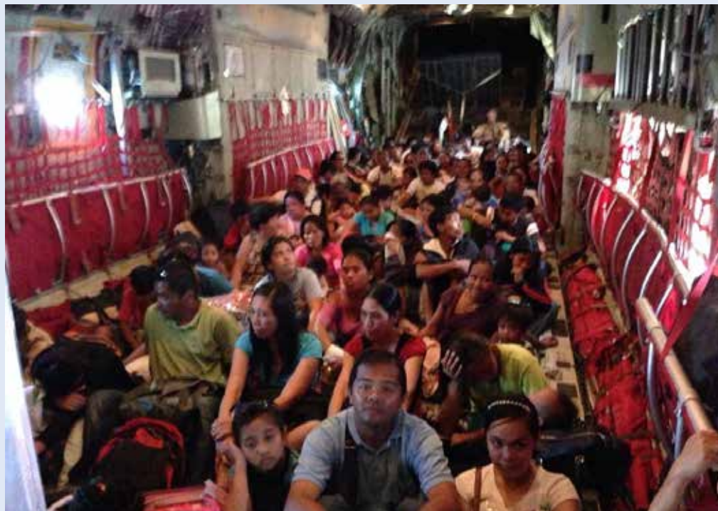
Maximalt antal passagerare i en Hercules är 88, men nu flögs cirka 110 personer åt gången. Det sägs att när amerikanerna evakuerade sig ut ur Vietnam, så packade de runt 400 passagerare i en Hercules.

– Man kan beskriva tyfonens framfart som om någon där uppe tagit en brödkavel, fem mil bred och bara rullat fram över