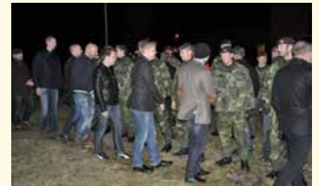
Medlemmar ur kamratföreningen gratulerar soldater på kompaniet till väl genomförd lodjursmarsch