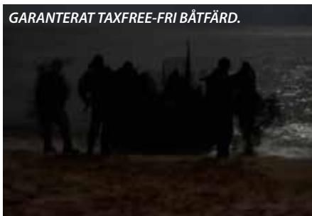
GARANTERAT TAXFREE-FRI BÅTFÄRD.

- De är intresserade när jag berättar, men kunskaperna om GSS/T är bristfälliga i hela samhället och riksdagen är inget undantag. Jag tror att många svenskar precis börjat förstå att vi inte längre har värnpliktiga.