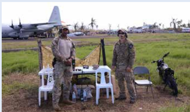
”Flygtornet” i Ormoc, något spartanskt men fullt fungerade. Motorcykeln fanns där så att en av soldaterna/flygledarna kunde inspektera landningsbanan.