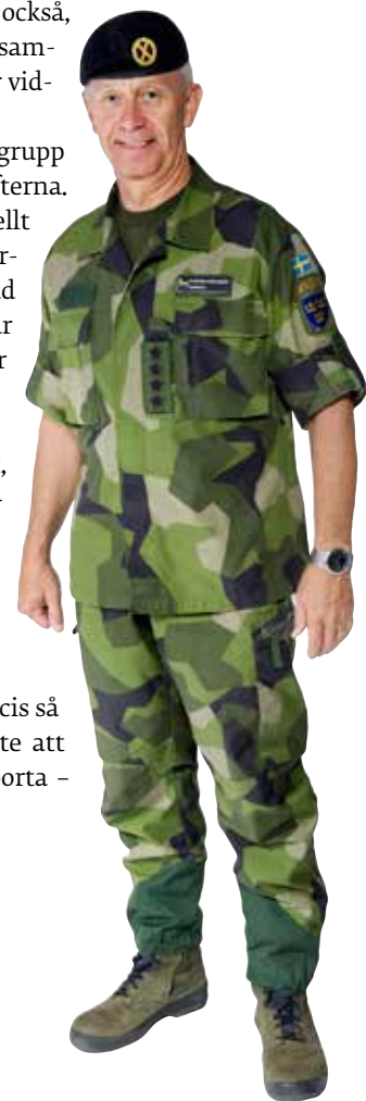
Sverker Göranson Överbefälhavare

God jul, gott nytt år och väl mött igen 2014!