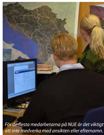
För de flesta medarbetarna på NUE är det viktigt att inte medverka med ansikten eller efternamn.

– Ena dagen håller man presentation för högsta politiska ledningen, nästa bearbetar man en fråga som ställts av Försvarets insatschef och den tredje kanske man står och går genom hotbilderna för soldater i insatsområdet. Detta