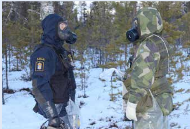
Tullverkets och Försvarsmaktens medarbetare samarbetade väl under övningen.

och reaktionsförmåga för att inte plötsligt ha passerat ett utslag som kan ha kommit från ett mindre kolliderande momentet skulle grupperna undersöka misstänkta containrar och där bestämma om de innehöll radioaktivt material, var i containrarna och även vilken typ av material det kunder