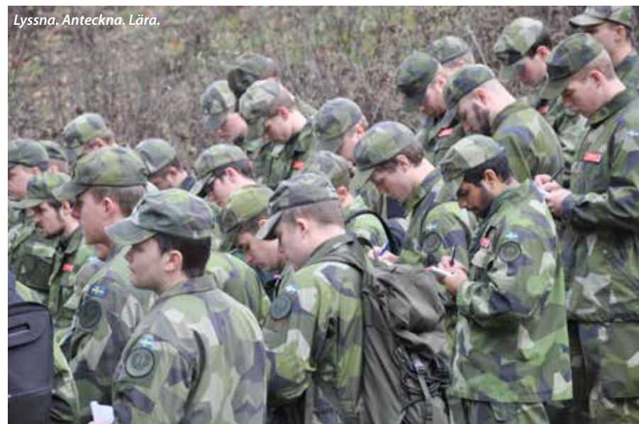
Lyssna. Anteckna. Lära.