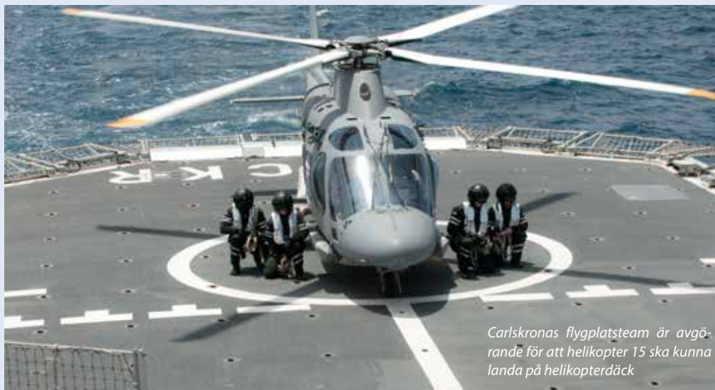
Carlskronas flygplatsteam är avgörande för att helikopter 15 ska kunna landa på helikopterdeck