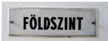
Földszint? Markplan på ungerska.