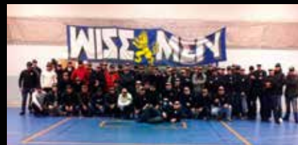
Wisemen - inte Wiseman. Stor skillnad.

”Jag tycker det finns en stor blåögdhet parallellt med en besserwisser-attityd. Jag ser en många gånger enorm diskrepans mellan hur man på politisk nivå beskriver Försvarsmakten och dess verksamhet, kontra den bild jag själv har och som jag får förmedlat till mig. Man måste bli mycket bättre på att gå under ytan istället för att förbluffas av kulisser och smicker. Jag upplever att man är alldeles för dåligt insatt i sakfrågorna. Ska man ansvara för Sveriges försvarsförmåga om 20 år så måste man sätta sig in i sakfrågor på ett helt annat sätt än vad som nu sker.”