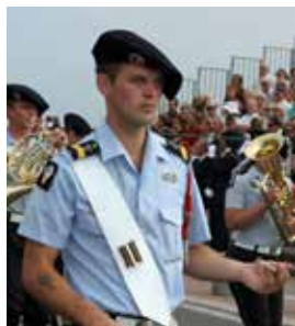
Franska Chasseurs Alpins .

För pansartrupperna var baskern också praktisk: man kunde ha hörlurar till den, den kunde vadderas för att fungera som en mjuk hjälm och den hade inga kanter som stack ut i den trånga stridsvagnen.