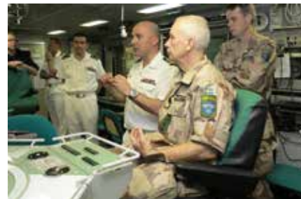
Utrustningen i stridsledningscentralen på det portugisiska fartyget Álvares Cabral är som hämtad ur en James Bond-film. "Den är över 20 år gammal men vi kan ändå leda strid härifrån", försäkrar fartygschefen.

I foajén på det djiboutiska försvarshögkvarteret står luften helt stilla. Inne på stabschefens rum är det dock annorlunda. Här är det svalt och det luktar sött och kryddigt som från rökelse. Där inne väntar Djiboutis försvarsminister. Han tillträdde posten för tre dagar sedan. En kvinnlig stabsassistent kommer in med en bricka med läsk i höga, gröna glas. När hon ska ställa de två sista glasen på det bruna bordet tappar hon brickan. Läsken