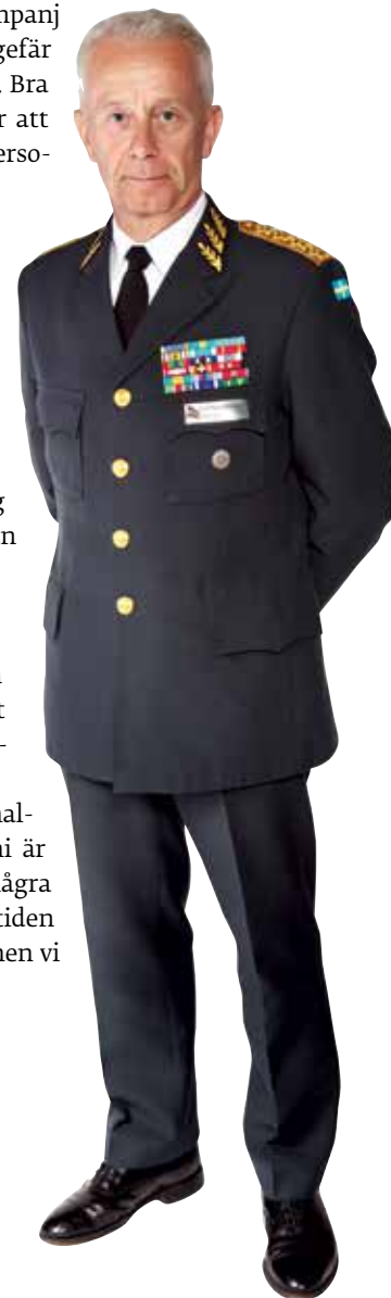
Sverker Göranson Överbefälhavare

Passa på att njuta av våren, nu när den äntligen är i antågande.