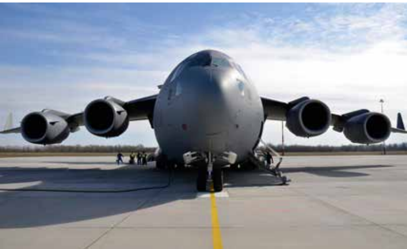
Bara på rampen kan en C-17 lasta lika mycket som en Herkules. Totalt kan en C-17 lasta 77 ton.