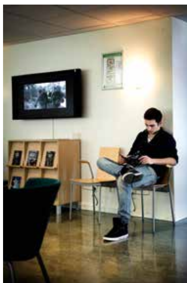
VÄNTAN. Även om dagens testdagar är effektiva så blir det en del dödtid.

minuter. Testet är dynamiskt, det vill säga att det anpassar sig efter hur testpersonen svarar: Svarar man rätt flera gånger i rad, blir frågorna svårare och tvärtom. Ändå är det sju procent av de som testas som inte klarar provets lägsta nivå. Och frågorna är hemliga så att de testande inte ska kunna lära sig svaren innantill.