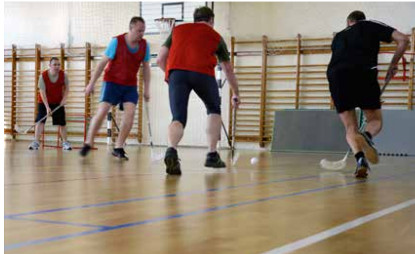
Innebandy spelas två gånger i veckan - en sport som är populär även hos andra nationer.

att storhandla mat, beställa bredband eller lämna in bilen på service.