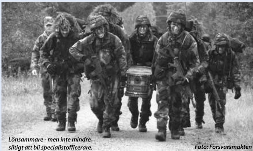
Lönsammare - men inte mindre slitigt att bli specialistofficerare.

En annan aspekt är att möjligheten kan sporra en del GSS/K att stanna kvar längre i sin anställning. Försvarsmaktens ambition är att GSS/K i genomsnitt