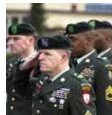
Amerikanska Special Forces.