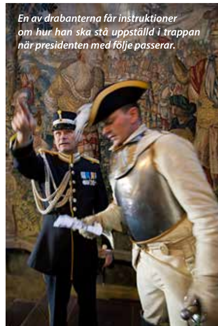
En av drabanterna får instruktioner om hur han ska stå uppställd i trappan när presidenten med följe passerar.

När Portugals president Aníbal Cavaco Silva besökte Stockholm i början av oktober, medverkade cirka 900 medarbetare från Försvarsmakten. De mötte upp med JAS 39 Gripen vid territoriella gränsen, paraderade på Arlanda, stod uppställda längs kortegevägen och på inre borggården när presidenten färdades längs Stockholms gator mot Kungliga slottet. Där fick han och hans medföljande fru Maria Cavaco Silva ett högtidligt mottagande. Deltagarna samlades i Kungsträdgården innan avmarsch mot uppställningsplatserna. De kom från fem olika förband och dessutom deltog tre musikkårer. För polisen, som ansvarar för säkerheten, arbetade cirka 70 personer under statsbesöket.