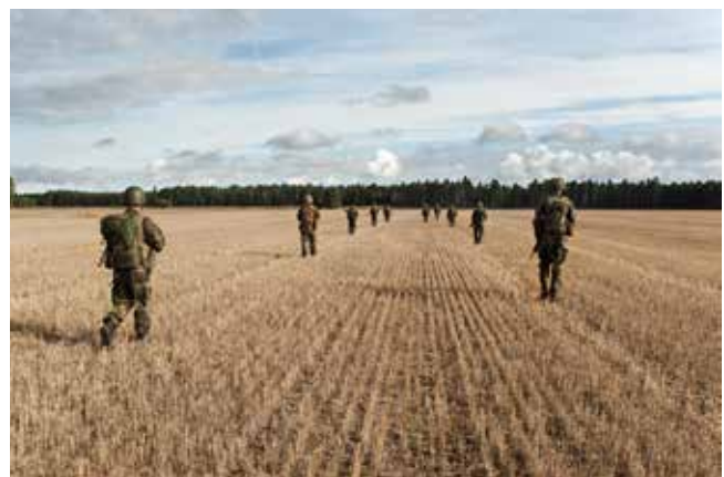
Efter landningen beger sig de tyska soldaterna mot samlingspunkten för de som ska evakueras