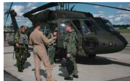
Första debrief sker så fort helikopterna har landat.

TEXT: LASSE JANSSON/HKPELJ OCH STEFAN ENGSTRÖM/LSS