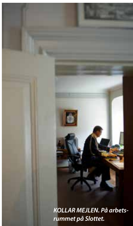
KOLLAR MEJLEN. På arbetsrummet på Slottet.

skärp, medaljer, bicorne, alltså hatt, med gula fjädrar, epåletter med buljoner samt sabel, vilket benämns stor parad.