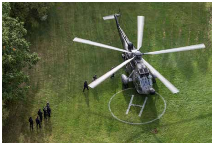
En bordningsstyrka på väg till helikoptern för att gå ombord på ett fartyg och kontrollera det.

stämda övningsmoment i ett schema, den andra är scenariostyrd, där fartygen ska agera och reagera på yttre händelser som de inte känner till på förhand.