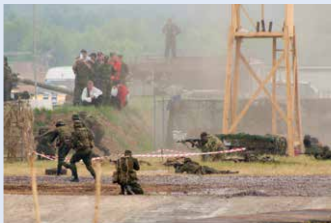
Ryska specialförband vid en förevisning 2003.

Och varför är en randig fiskartröja av franskt ursprung så omhuldad av ryska elitförband?