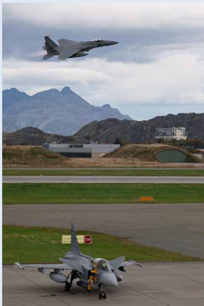
En av flygbaserna som användes under ACE 13 var den i norska Boda.