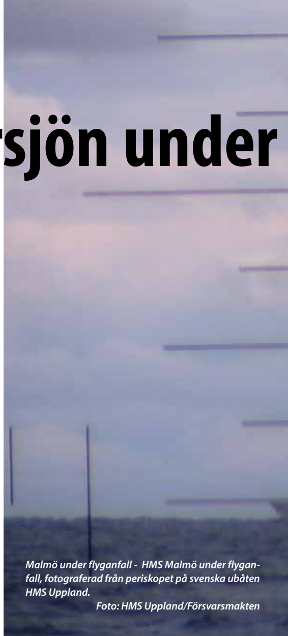
Malmö under flyganfall - HMS Malmö under flyganfall, fotograferad från periskopet på svenska ubåten HMS Uppland.

Årets stora övningsnyhet var att Sverige stod för värdskapet och hade tillsammans med Tyskland planerat övningen. När ett trettiotal fartyg och ett tjugotal helikoptrar och flygplan tillsammans med markförband ska öva tillsammans, ställs stora krav på noggrann planering. Ett svenskt team har jobbat i närmare två år med att planera övningen, som likt de flesta andra övningar består av två faser: Den första är indelad i förutbe-