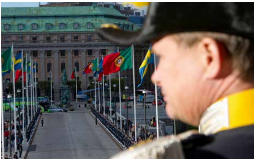
I filmen "Elegans och precision vid prinsessbröllopet" på Försvarsmaktens YouTube-kanal finns mer om Richard Beck-Friis arbete – www.youtube.com/forsvarsmakten

centrerad. Så rullar kortegen med presidentparet i hästdragen vagn in och ceremonin kan börja.