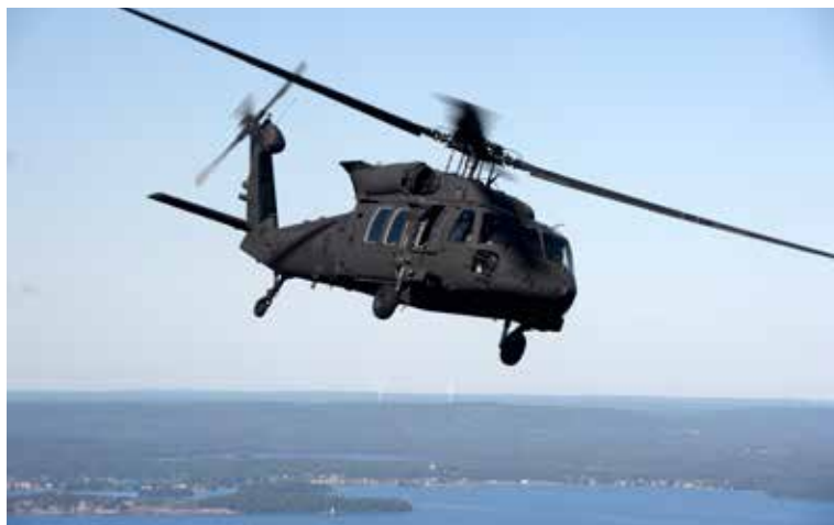
En helikopter 16 i närheten av övningsområdet vid Vättern.