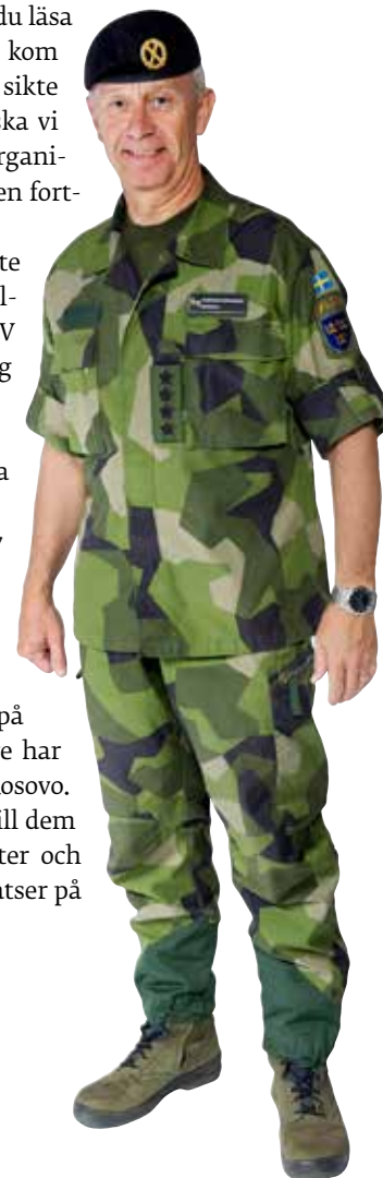
Sverker Göranson Överbefälhavare

Stort tack för era insatser. Ni har alla gjort skillnad!