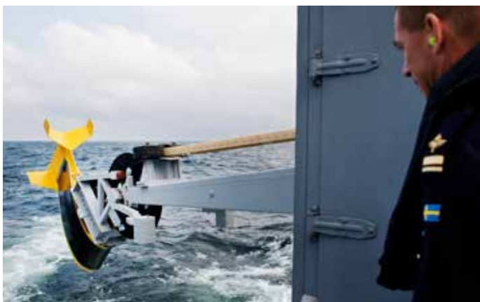
Sonaren på HMS Malmö sjösätts inför en ubåtsjaktövning.