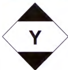
Tabell 1:10 Märkning

Vid transport som föregås av eller som följs av, flygtransport, ska märkningen vara kompletterad med "Y"