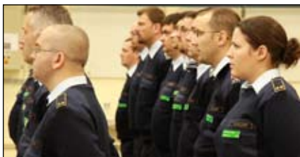
Den första utländska kvinnliga JAS-teknikern är nu utexaminerad.

– Svenskarna är mycket trevliga, och alltid glada, tycker han.