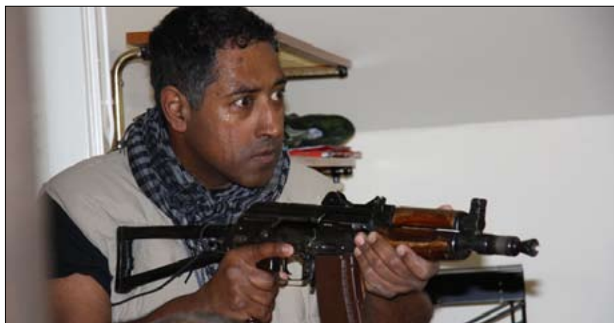
Förutsättningarna vid mötet förändras helt när en hotfull milisman rusar in.

Sjukhus som söker militär hjälp, borgmästare som har problem med lag och ordning i städer, en rektor som försöker hindra en krigsherre att rekrytera studenter – det var några av de problem som Nordic Battlegroups team för civil-militär samverkan (CIMIC) ställdes inför när de övade tillsammans vid Lv 6 i Halmstad.