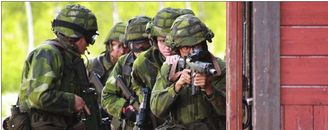
Stridsgruppen påbörjar uppgiften att genomsöka byggnadens nedre våning.

Skotten ekar skarpt mellan husväggarna i SIB-anläggningen (Strid i bebyggelse) på Mästocka-fältet utanför Halmstad. Några rekryter från Luftvärnsregementets KMU (Kompletterande Militär Utbildning) har just varit med om sin första sammanstötning med fienden under ett genomsök av en byggnad. KMU är deras "brygga" mellan den nyss genomförda GMU:n och en väntande yrkesofficersutbildning till hösten.