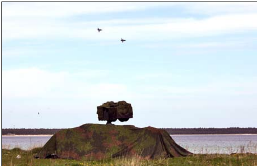
En rote Gripen flyger tätt för att försvara låsning från belysningsradarn.

Luftvärnet har övat strid mot luftmål på norra Öland. Målet med övningen var att träna den 61:a luftvärnsbataljonen mot en avancerad motståndare som kom från F 7 och flygskolan.