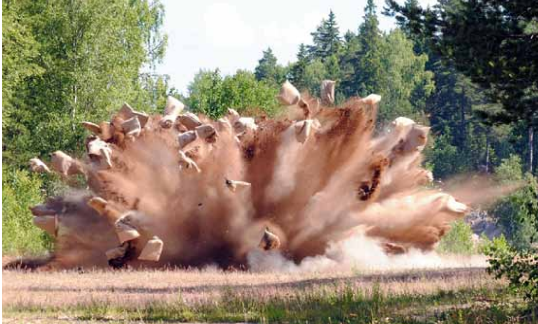
Detonation vid en kontrollerad sprängning inom Swedecs verksamhet.

– Ammunitionslära är ett väldigt stort område och ibland var det lite svårt att bestämma gränsdragningarna för innehållet. Men det var en intressant utmaning att få ner all den kunskap jag byggt upp under årens lopp i bokform.