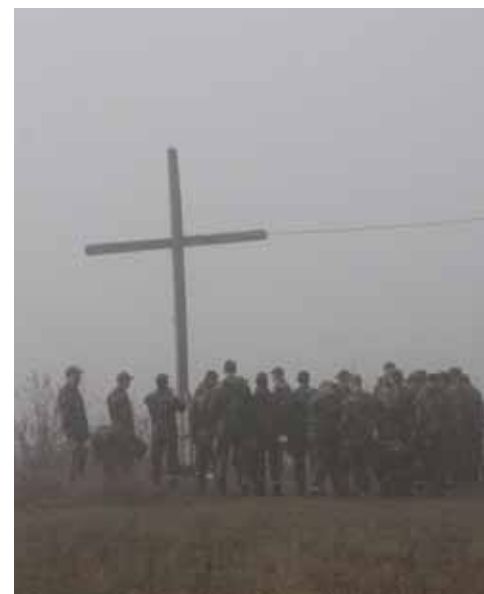
Korset syns från hela byn och visar att här bor kristna kroatter – den etnisk-religiösa tillhörigheten var en skiljande faktor under kriget och är så än i dag.