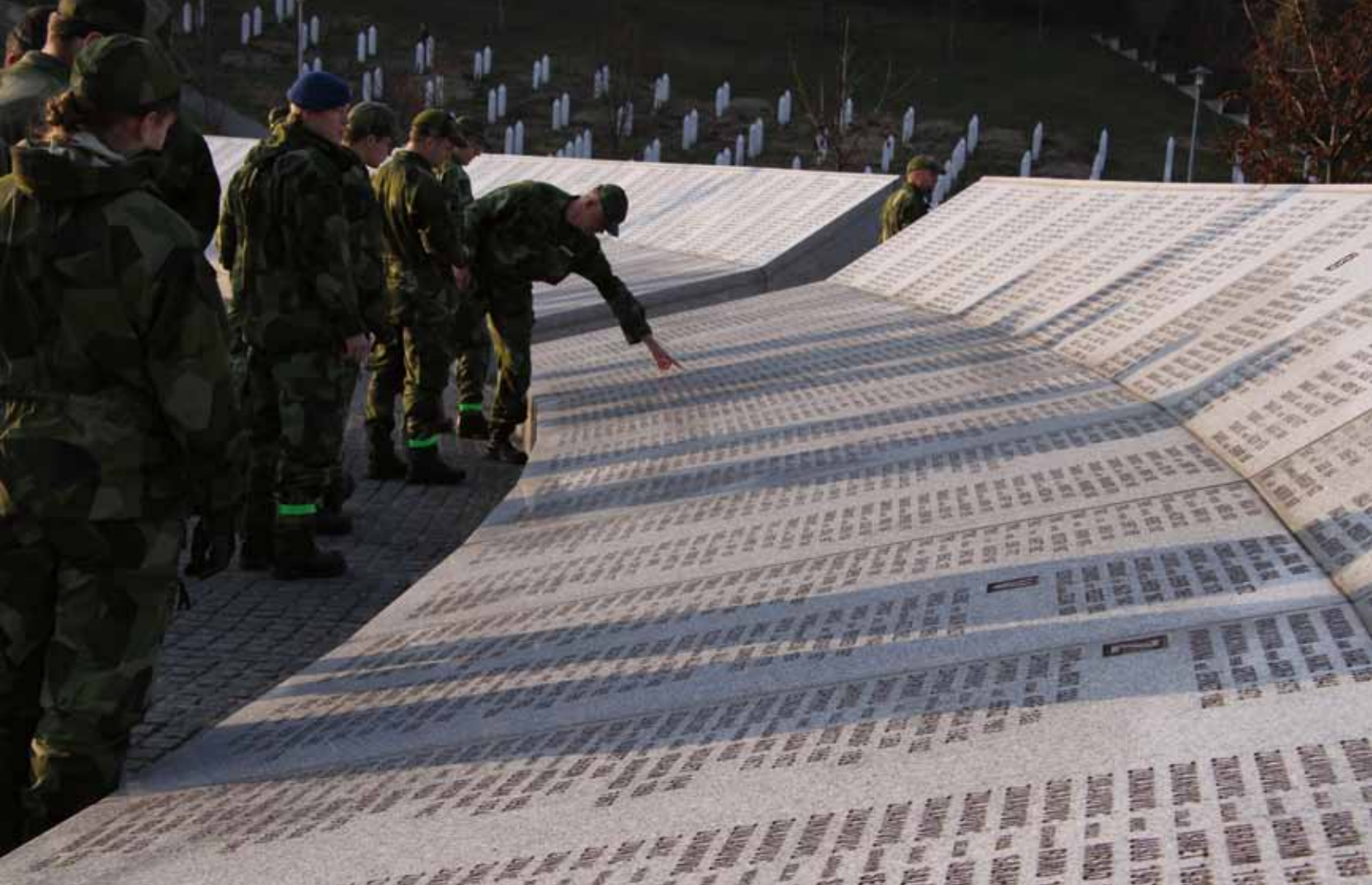
På begravningsplatsen utanför Srebrenica finns stentavlorna med namn i oändliga rader – offren för massakern.