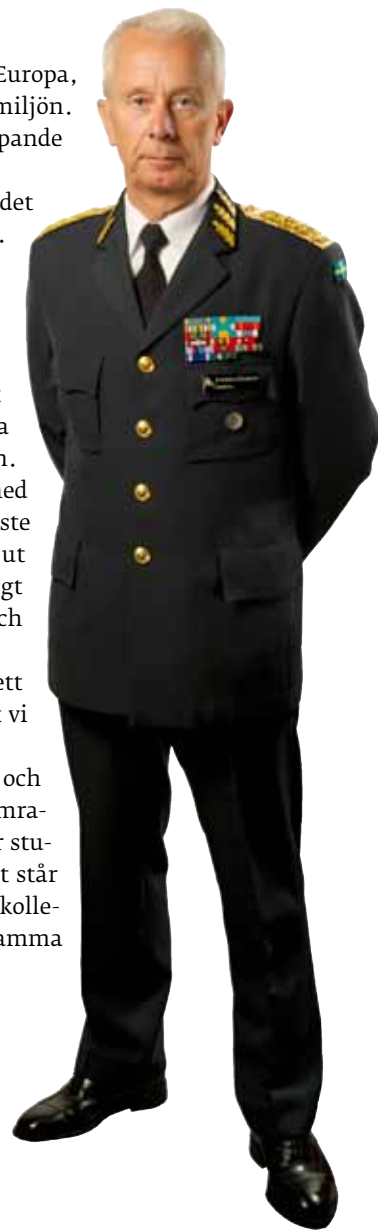
Sverker Göranson Överbefälhavare