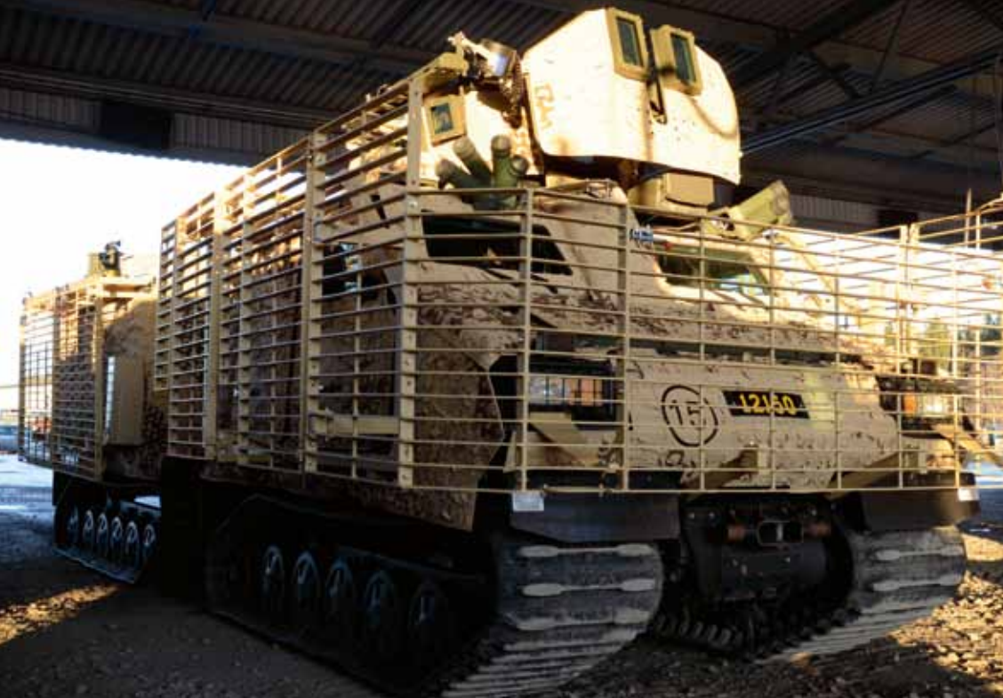
Femton bandvagnar leasas från Holland. Tio av dessa tillförs den svenska styrkan i Afghanistan.