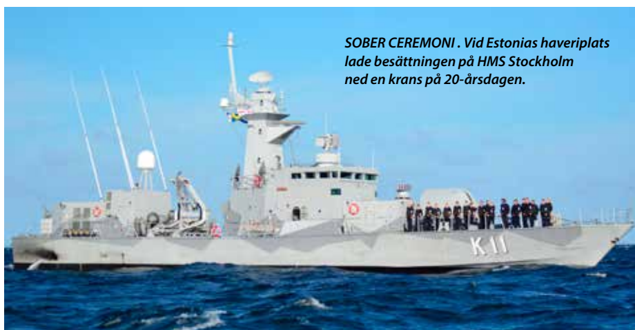
SOBER CEREMONI . Vid Estonias haveriplats lade besättningen på HMS Stockholm ned en krans på 20-årsdagen.