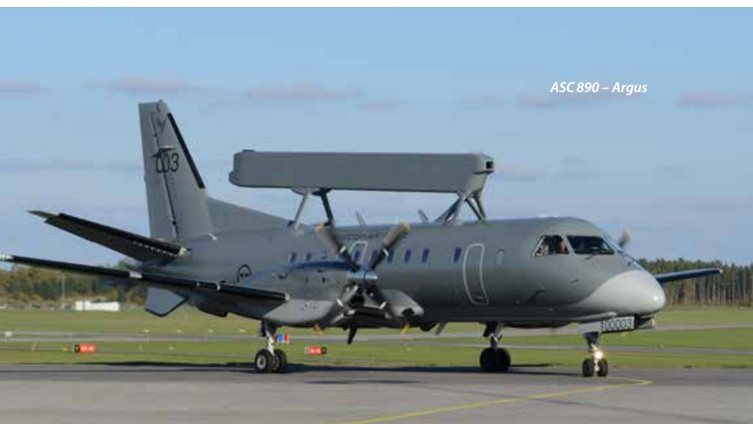
ASC 890 – Argus

Varken radar- eller signalspaningsplanen har i dag varnings- eller motmedelsystem. Därför är det oroande när de ryska planerna lägger sig bredvid och vänder magen uppåt för att skylta med sin beväpning.