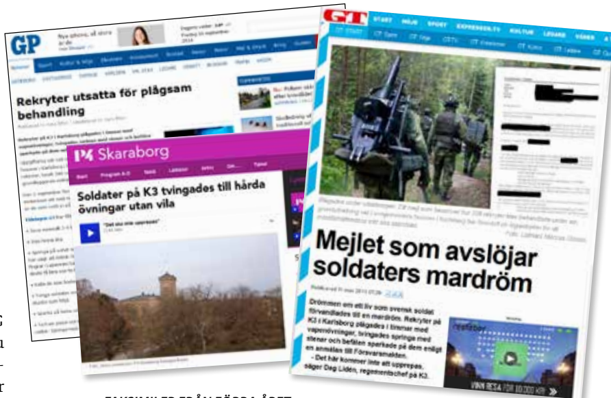
FAKSIMILER FRÅN FÖRRA ÅRET.

på K3 för ett år sedan, även om han inte själv var där då.