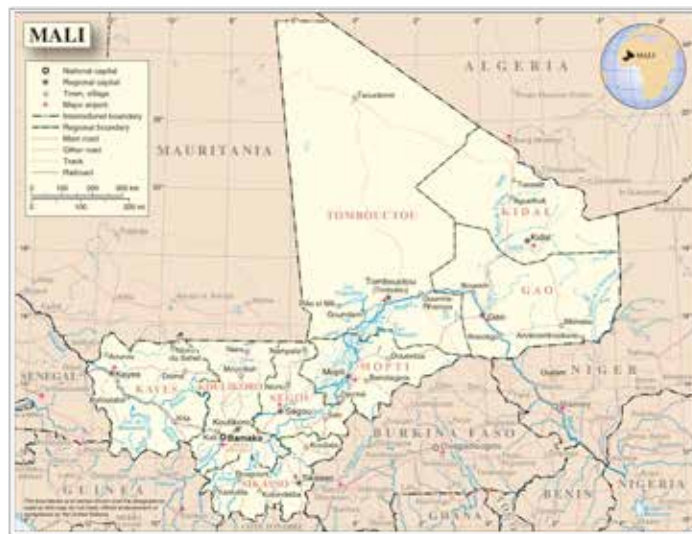
Den svenska truppinsatsen kommer vara baserade i sektor Väst, baserade i Timbuktu. I norra delen av sektorn bor färre än 1000 människor bofasta, samtliga i gruvsamhället Taoudenni.