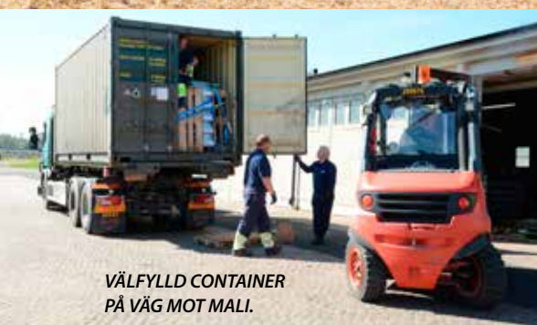
VÄLFYLLD CONTAINER PÅ VÄG MOT MALI.

Ingen insats fungerar utan logistik – och den bör vara välplanerad.