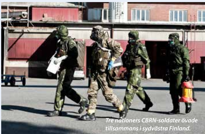
Tre nationers CBRN-soldater övade tillsammans i sydvästra Finland.