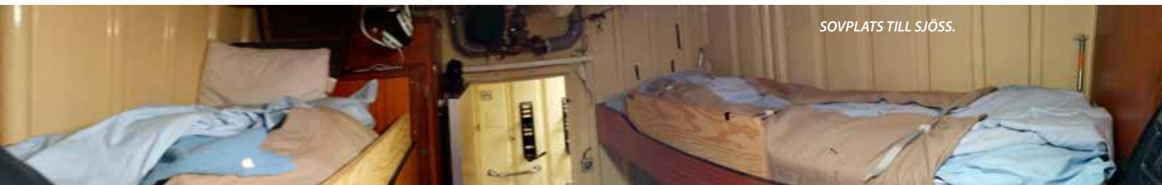
SOVPLATS TILL SJÖSS.