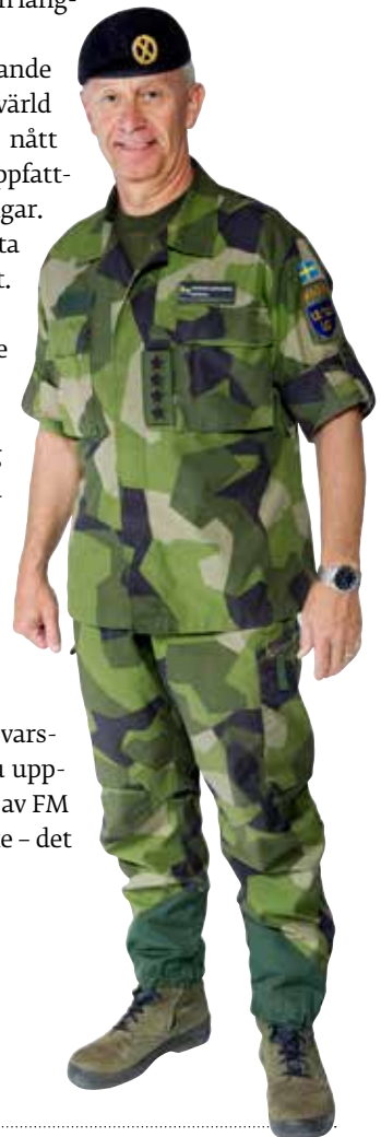
Sverker Göranson Överbefälhavare

Låt mig avslutningsvis slå ett slag för arbetet med att utveckla Försvarsmaktens framtida målbild. Detta arbete – roller/relationer – har vi nu uppdragit åt förbandscheferna att ta vidare som en åtgärd med anledning av FM VIND-undersökningen. Jag uppmanar alla att engagera sig i detta arbete – det är viktigt för Försvarsmaktens framtid!