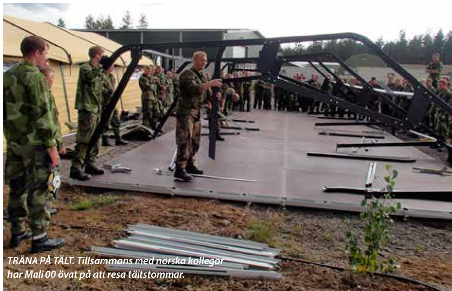
TRÄNA PÅ TÄLT. Tillsammans med norska kollegor har Mali 00 övat på att resa tältstommar.

Ungefär 7000 kvadratmeter av campens totala yta på 45000 kvadratmeter – något mer än sex fotbollsplaner – ska beläggas med betong. Och det är ett anläggningsarbete där allt material ("undan-