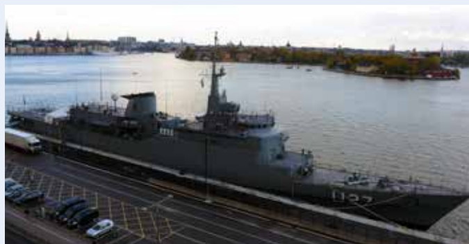
BNS BRASIL (U27), typ: modifierad fregatt av Niteroi-klass. I tjänst: 1984, längd: 129 meter, bredd: 13,5 meter, displacement: 3200 ton, beväpning: ingen.

Stockholmsbesöket skedde ungefär mitt i Brasils resa och beräknad hemkomst till Rio de Janeiro sker i december, då kadetterna kan titulera sig segundo-tenente , vilket motsvarar fänrik.