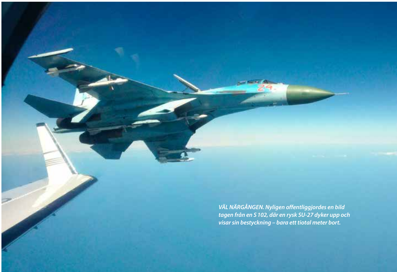
VÅL NÄRGÅNGEN. Nyligen offentliggjordes en bild tagen från en S 102, där en rysk SU-27 dyker upp och visar sin bestyckning – bara ett tiotal meter bort.

- Vår verksamhet är ju ett arv från den tid då DC3:an sköts ned 1952. Därmed är vi faktiskt ett svenskt förband som blivit officiellt nedskjutna, säger Kjell Ekström.