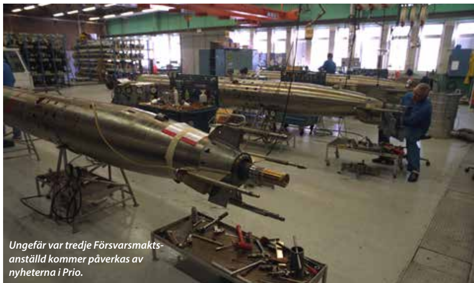
Ungefär var tredje Försvarsmaktsanställd kommer påverkas av nyheterna i Prio.

Funktionalitet för den tekniska tjänsten