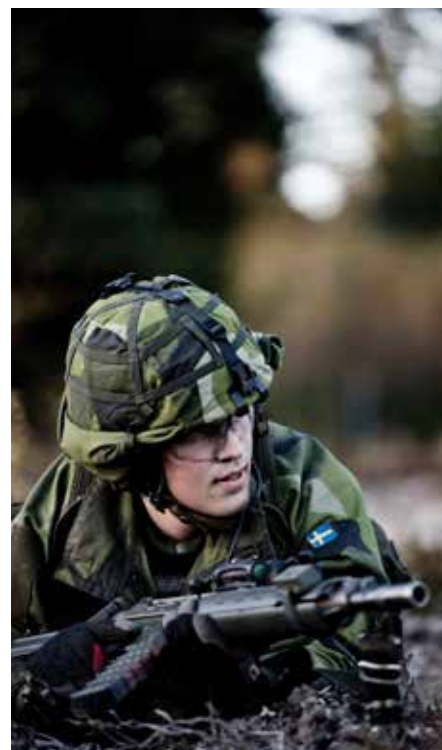
VINRÖD BYTS MOT BLÅ. Den vanligaste befattningen i Mali 01 är fallskärmsjägare, som nu får byta ut den vinröda baskern mot FN:s blåa.

– Det här är en nolletta och vi måste inse att allt kan komma att förändras under resans gång. Därför måste vi våga