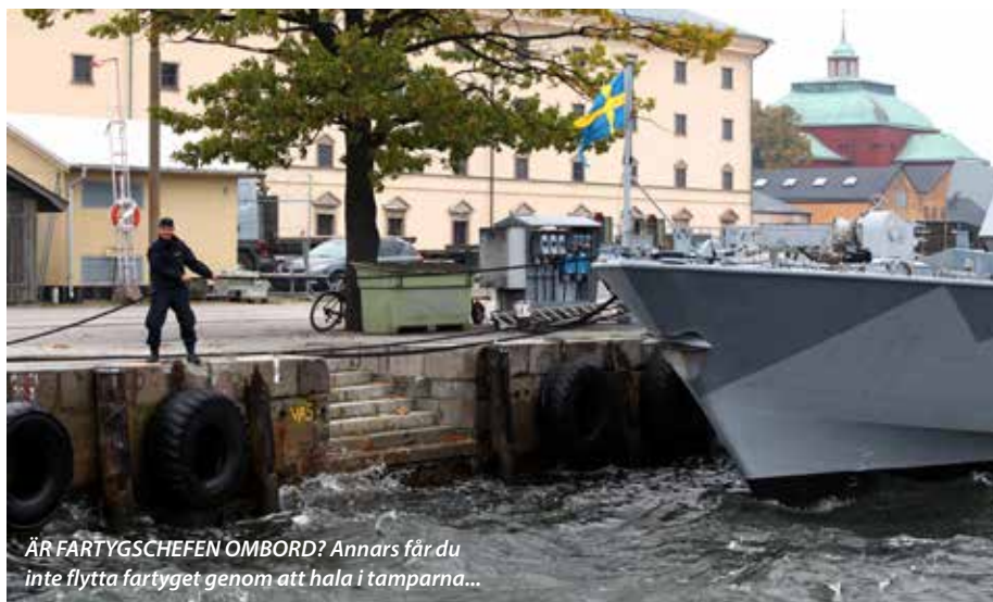
ÄR FARTYGSCHEFEN OMBORD? Annars får du inte flytta fartyget genom att hala i tamparna...