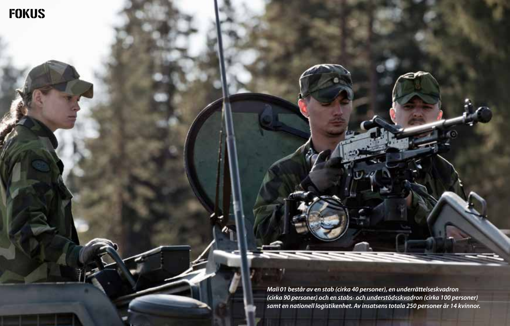
Mali 01 består av en stab (cirka 40 personer), en underrättelseskvadron (cirka 90 personer) och en stabs- och understödsskvadron (cirka 100 personer) samt en nationell logistikenhet. Av insatsens totala 250 personer är 14 kvinnor.

D et är en strålande, krispig höstdag i Bergslagen där trädens löv skiftat till brandens färger.