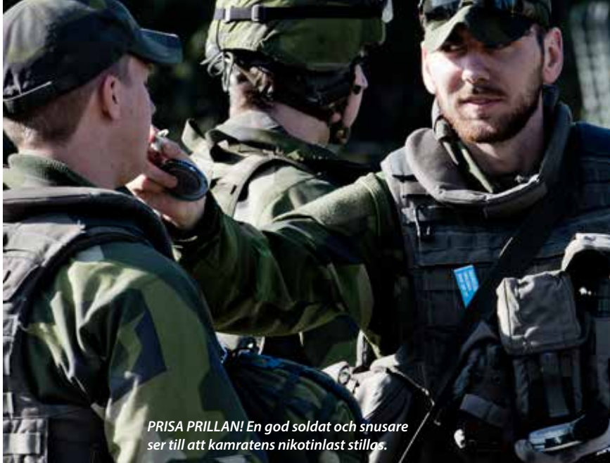
PRISA PRILLAN! En god soldat och snusare ser till att kamratens nikotinlast stillas.