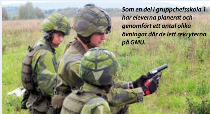
Som en del i gruppchefsskola 1 har eleverna planerat och genomfört ett antal olika övningar där de lett rekryterna på GMU.

Text: Anne-Lie Sjögren/P4