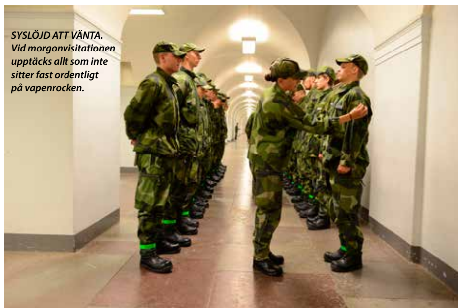
SYSLÖJD ATT VÄNTA. Vid morgonvisitationen upptäcks allt som inte sitter fast ordentligt på vapenrocken.

- De kanske har varit snabbast, starkast och snyggast i sin klass. Här är någon annan snabbast, starkast och snyggast. Då kan det vara lätt att bara ge upp och åka hem till pojk- eller flickrummet och jobbet i grönsaksdisken på Coop. I dag är det