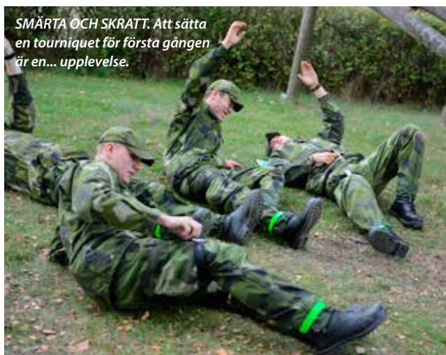
SMÄRTA OCH SKRATT. Att sätta en tourniquet för första gången är en... upplevelse.

– Det som skapar en bra jägare är sunda värderingar, viljan att ta ansvar och alltid lösa uppgiften. Det viktiga är att kommunicera med rekryten och soldaten om vad som krävs för att bli en bra skytt eller annan befattning. Jag pratar på samma