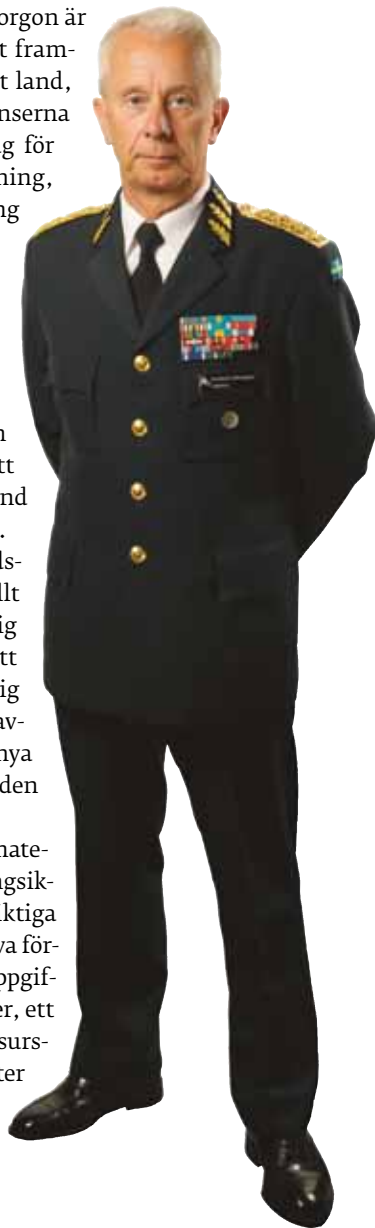
Sverker Göranson Överbefälhavare

Men allt kostar, oavsett om det gäller rekrytering, materiel eller övningar. Därför har jag kommunicerat vår långsiktiga ekonomi till statsmakterna. Det är svåra men viktiga frågor, som måste lösas för att vi ska ha dagens operativa förmåga även i framtiden. För att kunna lösa försvarets uppgifter i framtiden behövs fortsatta rationaliseringsåtgärder, ett mer effektivt internationellt samarbete men också resurstillskott. Det finns inga enkla lösningar, däremot möter jag dagligen medarbetare som aldrig ger upp!