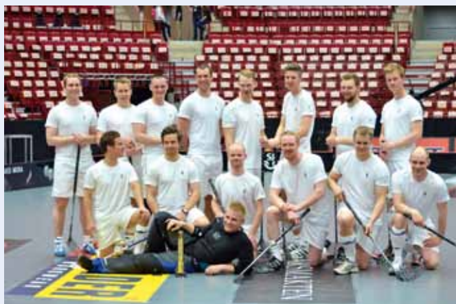
Försvarsmaktsmästare i innebandy 2012 blev Lag Norr.