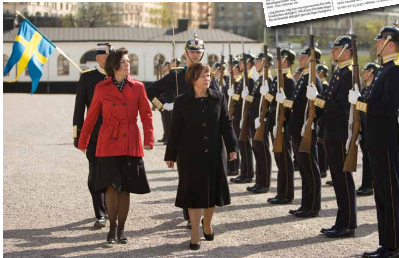
Karin Enström på MHS Karlberg tillsammans med Litauens försvarsminister Rasa Jukėvičienė.