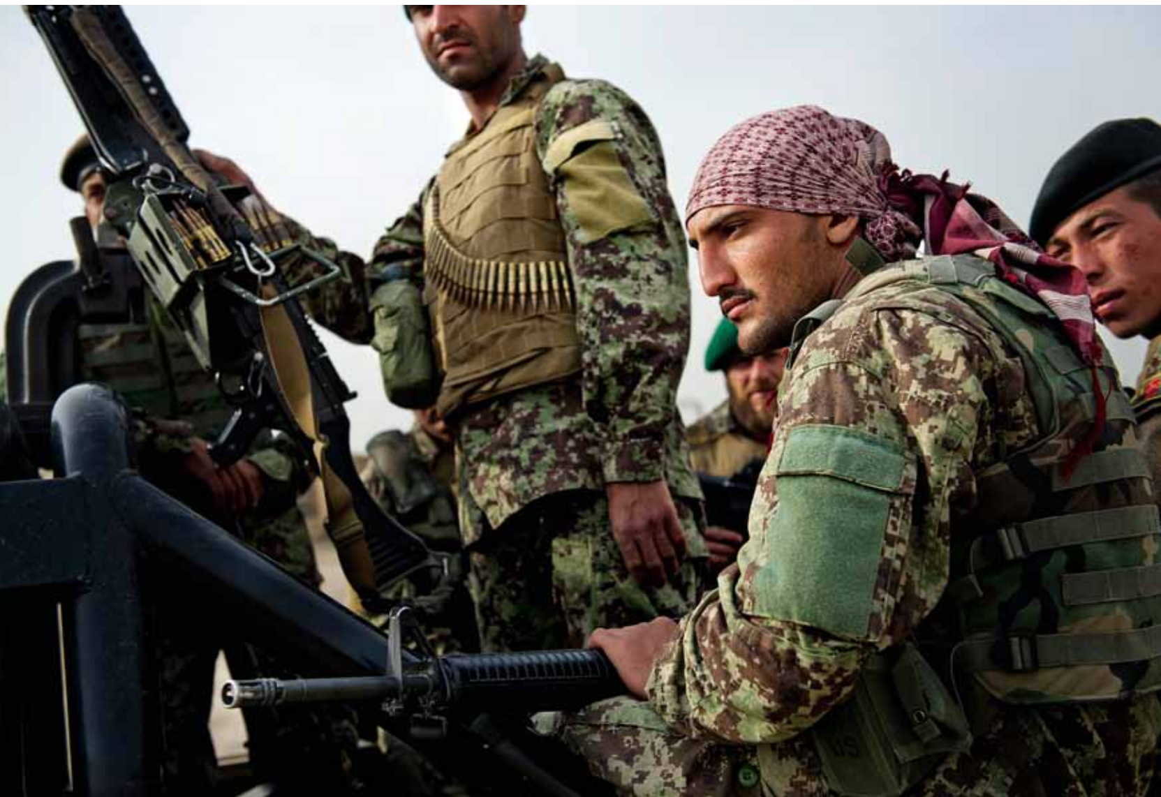
Svenska OMLT lever sida vid sida med den afghanska armén.