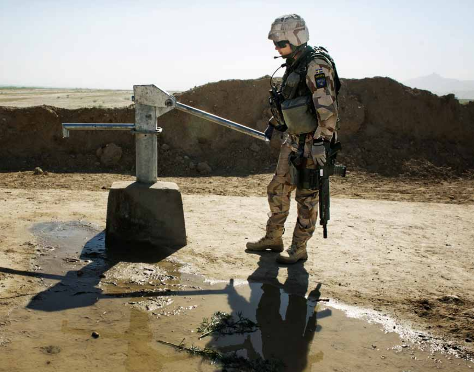
Svenska soldater stöttar ett brunnbygge väster om Mazar-e Sharif