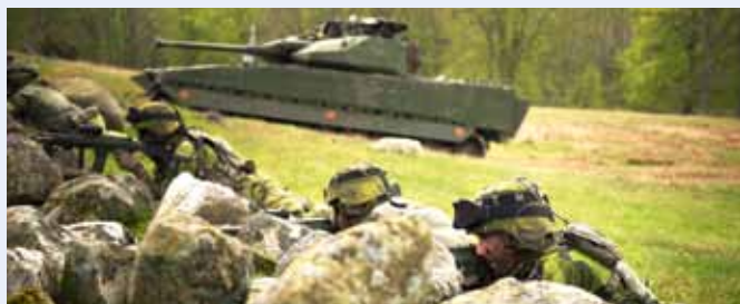
Text: Caroline Segerdahl/MSS

Markstridsskolan ansvarade för planering och genomförande på uppdrag av arméinspektören.