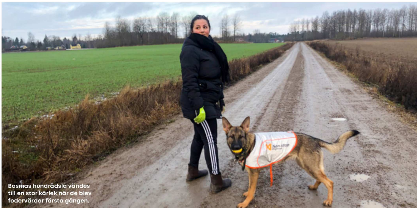
Basmas hundrädsla vändes till en stor kärlek när de blev fodervärdar första gången.