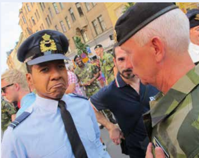
INGA SURA MINER PÅ PRIDE. Den nederländska försvarsmaktens representant var mäktat imponerad av att Försvarsmakten medverkade i Pride.