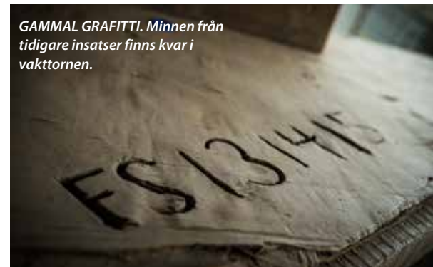
GAMMAL GRAFITTI. Minnen från tidigare insatser finns kvar i vaktornen.