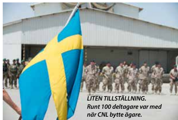
LITEN TILLSTÄLLNING. Runt 100 deltagare var med när CNL bytte ägare.

C amp Northern Lights i Mazar-e-Sharif har sedan det stod färdigt 2006 varit hem för fler än 7000 svenska soldater och officerare som tjänstgjort i Afghanistan. Från början var förläggningen tänkt att rymma 150 personer med potential för totalt 250. Inom kort var dock styrkan utökad till 400 personer och Camp Northern Lights – ofta förkortat CNL – växte.