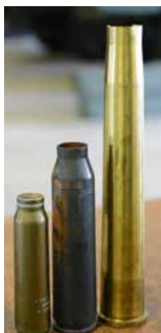
DET SITTER I STORLEKEN. Från vänster: norsk 30 mm, dansk 35 mm och svensk 40 mm ammunition.

- Visst, de andra ländernas versioner har mer elektronik men det gör dem också mer sårbara. Våra vagnar tål det mesta. Och behövs det så kan vi styra och skjuta med vevar och pedaler, säger förste serge-