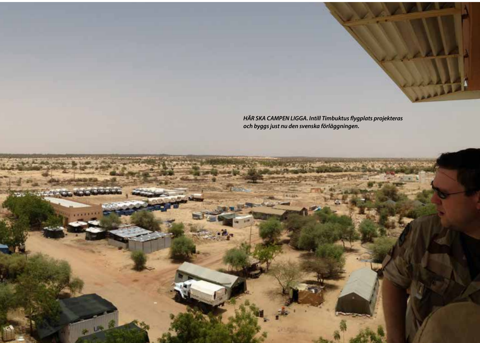
HÄR SKA CAMPEN LIGGA. Intill Timbuktus flygplats projekteras och byggs just nu den svenska förläggningen.

svarande volymen av 20 Gizapyramider som måste bort för att kunna ha en yta att bygga en camp på.