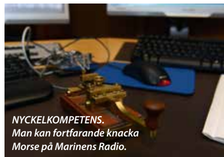
NYCKELKOMPETENS. Man kan fortfarande knacka Morse på Marinens Radio.