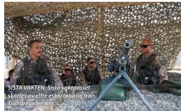
SISTA VAKTEN. Sista vaktpasset sköttes av elfte eskortpluton från Trängregementet.

med mig erfarenheten att uppskatta att jag och min familj lever i ett land i fred och frihet.