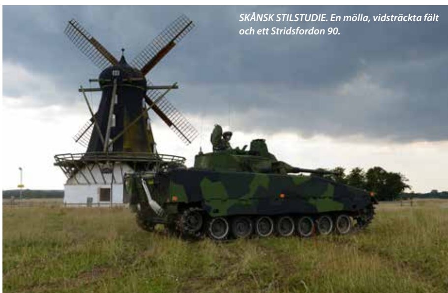
SKÅNSK STILSTUDIE. En mölla, vidsträckt fält och ett Stridsfordon 90.