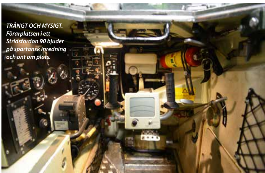
TRÅNGT OCH MYSIGT. Förarplatsen i ett Stridsfordon 90 bjuder på spartansk inredning och ont om plats.