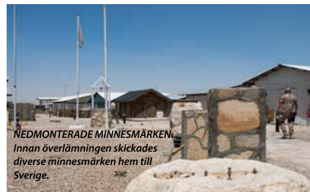
NEDMONTERADE MINNESMÄRKEN. Innan överlämningen skickades diverse minnesmärken hem till Sverige.