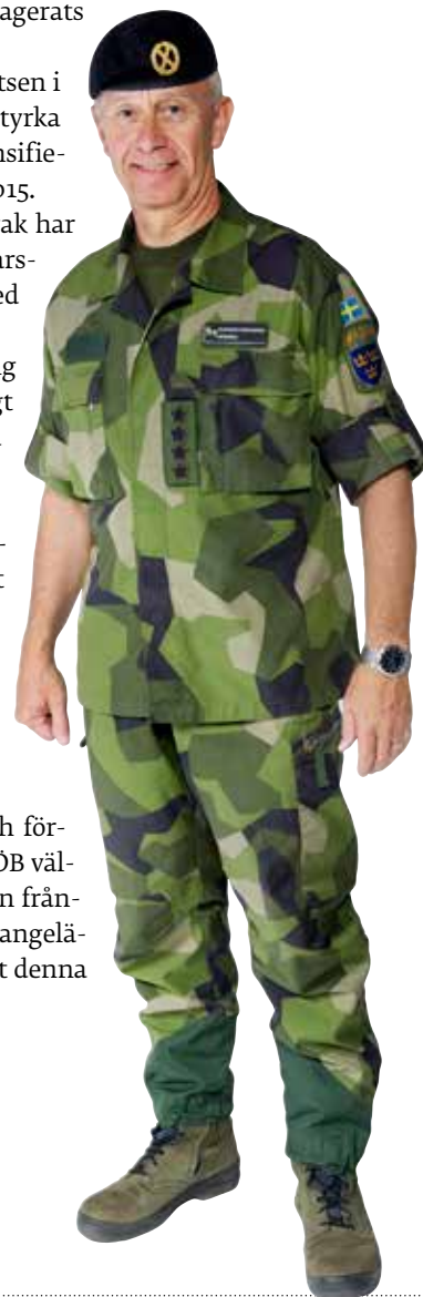
Sverker Göranson Överbefälhavare

Som väl inte undgått någon debatteras nu säkerhets- och försvarspolitiska frågor flitigare än på många år i Sverige. Som ÖB välkomnar jag det. En sådan debatt har alltför länge lyst med sin frånvaro och det skärpta omvärldsläge vi nu har gör den än mer angelägen. Försvarsmakten har här en viktig uppgift att bidra till att denna debatt förs på den sakliga grund som frågorna förtjänar. Väl mött i höst!