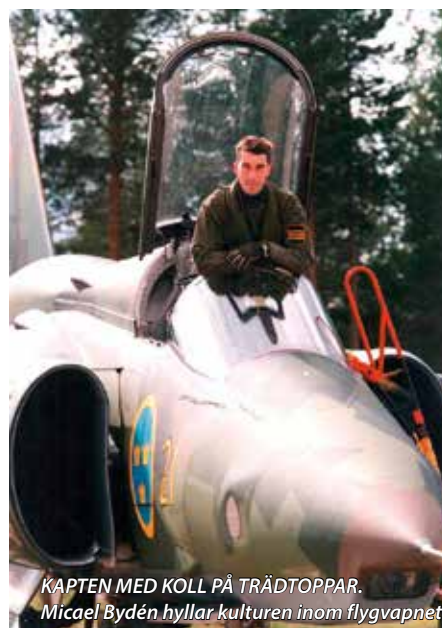
KAPTEN MED KOLL PÅ TRÅDOPPAR. Micael Bydén hyllar kulturen inom flygvapnet.

Kulturen innebär att man öppet vågar rapportera och lära av misstag och där ansvarsfördelningen är tydlig. Den kultu-