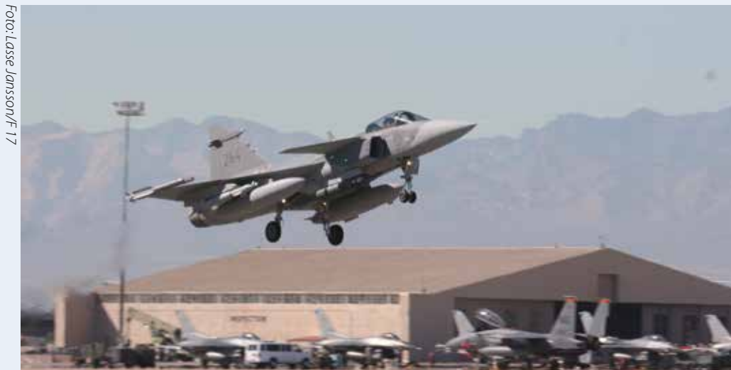
En Gripen startar, med amerikanska F-15 och F-16 i bakgrunden. Sammanlagt åtta Gripen deltog i Red Flag.