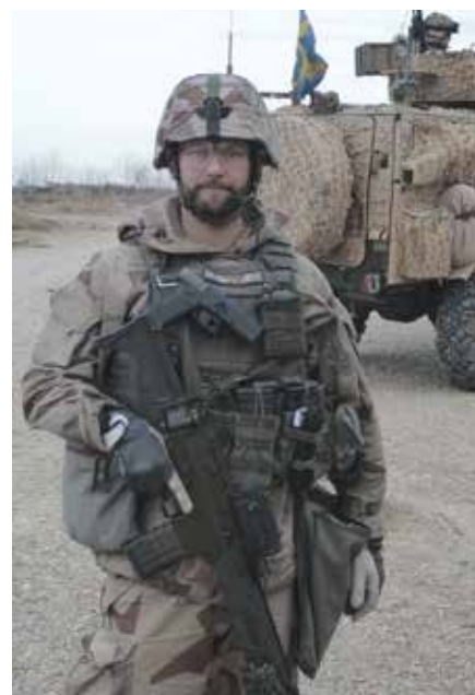
Föredöme, tillit och prestigelöshet – tre viktiga ord i Andrés chefskap.

– Just nu är jag i Afghanistan men slumpen har gjort så att jag kommer hem på nästa leave dagen innan galan