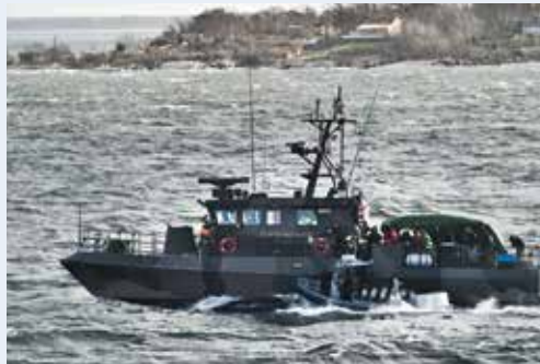
En av många ordningsövningar av så kallad dhow, i det här övningsfallet med HMS Dristig.