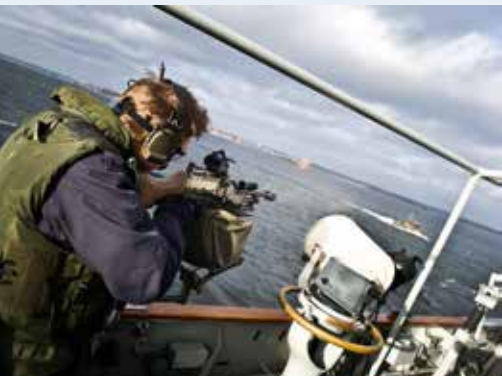
Vid bordningar ger HMS Carlskrona vid behov eldunderstöd.

Och det är en rutinerad besättning – flera besättningsmedlemmar är med för både andra och tredje gången.