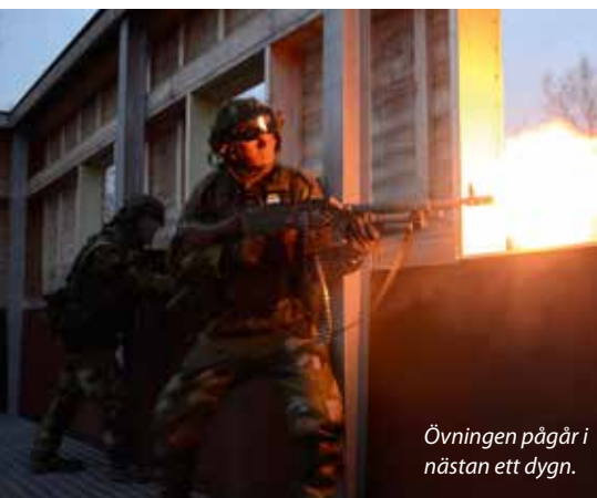
Övningen pågår i nästan ett dygn.