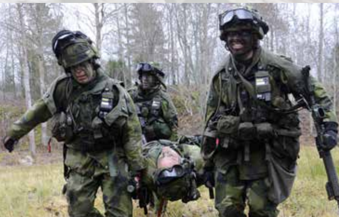
Sjukvårdsplanen fungerar och de som sårats under inbrytningen tas om hand.

På fritiden: Sport och idrott, "jag har spelat mycket fotboll själv, sedan är jag Djurgårdare med säsongskort". Gillar att resa och upptäcka nya platser, "Toscana är en favorit". Försöker att inte ta med sig jobbet hem, "jag tar aldrig med arbetsmaterial hem, då är det bättre att sitta kvar ett par timmar".