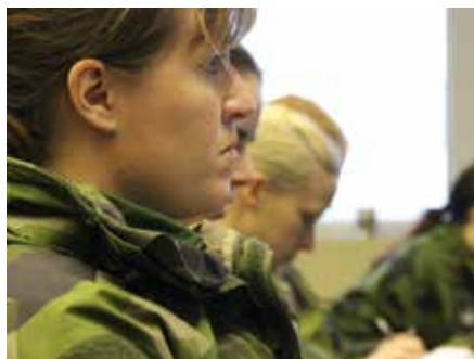
I nätverket NOAK – Nätverk Officer Anställd Kvinna – utbyts erfarenheter och kunskaper.

Under värnpliktstiden fanns Nätverket för kvinnliga värnpliktiga, NVK. Dessutom hanterade Värnpliktsrådet frågor om jämställdhet och likabehandling. Fokus var på hur värnpliktiga behandlades och deras situation under utbildningen. Stödet och mandatet kom både från politikerna och från Försvarsmakten. Parallellt fanns centrala nätverk för anställda kvinnliga officerare. När värnplikten blev vilande var varken NVK eller Värnpliktsrådet längre aktuella, men HR-centrum hade fortfarande i uppdrag att ordna nätverksträffar för kvinnliga försvarsmakts anställda. Nätverket Officer Anställd Kvinna, Noak, bildades. Syftet är att samla civila och militära kvinnor inklusive soldater från GSS-nivå och uppåt och ge möjlighet att utbyta erfarenheter och inspirera via förebilder. Även män som på olika sätt