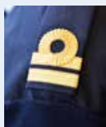
Kapten i dag, förvaltare i morgon?

För fem år sedan fattades beslutet om tvåbefälssystemet – med officerare och specialistofficerare. Nu pågår uttagning till regements- och flottiljförvaltare samtidigt som nya regler om frivillig omgalloning beslutats.