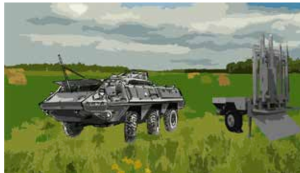
Robot 98 är tre meter lång, väger nästan 90 kilo – och har en hastighet på mach 3.

– Vi får nu ett betydligt vassare luftvärn för korträckviddsområdet. Nu börjar