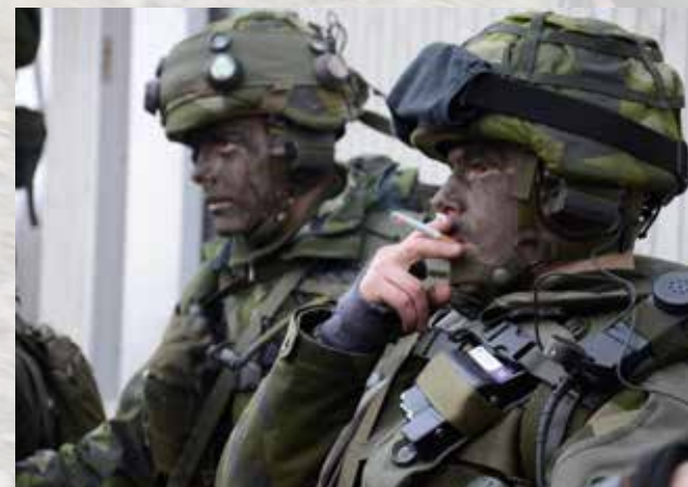
Paus – och en del utnyttjar den efter bästa förmåga och förstånd.

07:03 Kompaniet rullar iväg mot fordons- avlämningsplatsen.