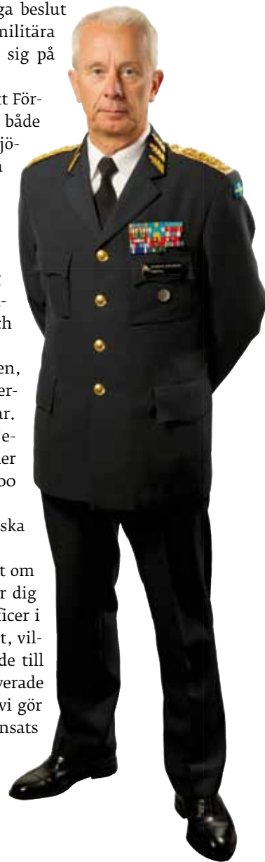
Sverker Göranson Överbefälhavare

För det är ingen tvekan, du gör skillnad, oavsett om du arbetar som militärpolis på Livgardet, utbildar dig till jägare i Arvidsjaur eller tjänstgör som stabsofficer i Norge. Intresset för Försvarsmakten är fortsatt högt, vilket antalet ansökningar visar. Totalt 5 500 sökande till 860 utbildningsplatser för GMU. Vi möter motiverade ungdomar som vill göra skillnad. Och jag vet att vi gör skillnad, för de människor som får vår hjälp är vår insats ovärderlig.