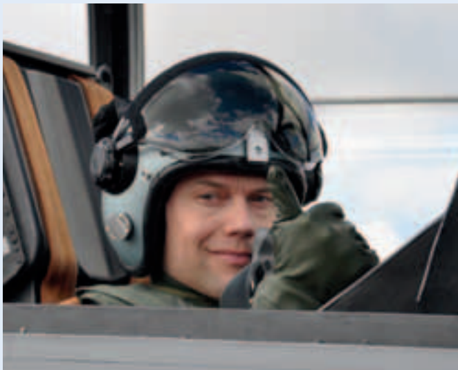
Prins Daniel provflög JAS 39 Gripen vid ett besök på F 21.